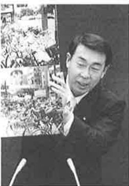
パネルを使い議会で質問

答(局長) 料金の差というより、渇水時においても安心して利用できるというメリットが大きい。利用者の信頼回復に向けて国の研究機関と連携しながら、早急な改善を図り、安心して利用できる中水道システムづくりをすすめる。