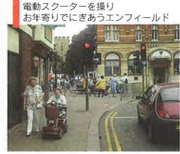
電動スクーターを操りお年寄りでにぎあうエンフィールド

ロンドン近郊 ホーシャム地区 安心、安全で雰囲気良い 下村 車社会問題が再開発に取り組みきつかけでして、歩行者が安心して街を歩けないなど車の街の乗り入れ状況は深