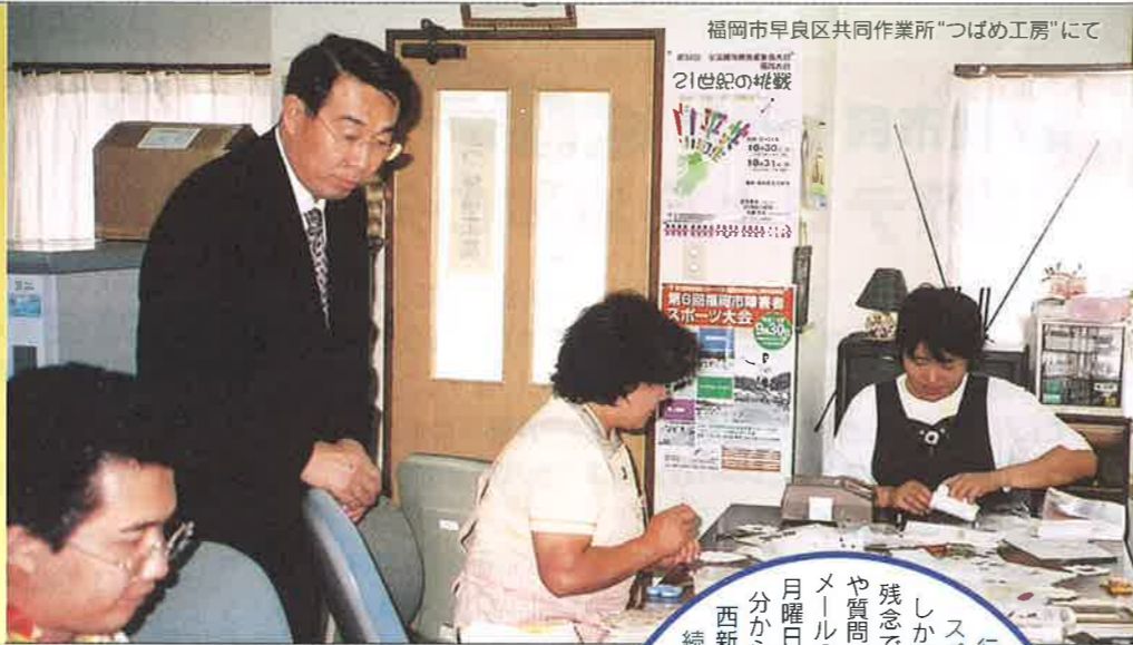
福岡市早良区共同作業所「つばめ工房」にて

発行者:福岡市議会議員 橋木義博 〒814-0001 福岡市早良区百道浜1-3-13-305 TEL.845-7669 FAX.845-8511 E-mail:tochigi@bronze.ocn.ne.jp